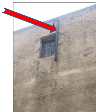
Gouttière façade ouest