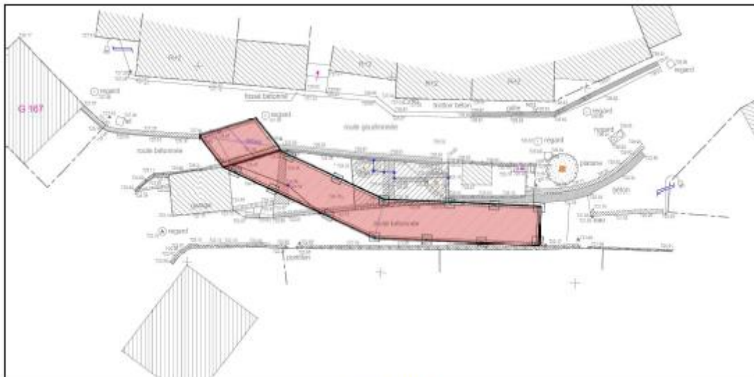
Projet sur fond topo

En l'état actuel nous disposons de l'avant-projet de passerelle du maître d'œuvre (B.E.T. Pozzo di Borgo) et de l'étude béton (société ISB pour un montant de 2 400,00 € HT) : programme de travaux et estimation financière (405 000,00 HT soit 451 586,00 TTC).